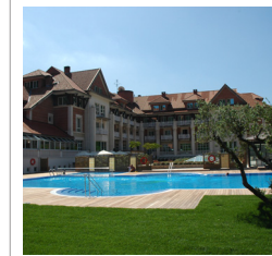
Puente Viego (Cantabria)