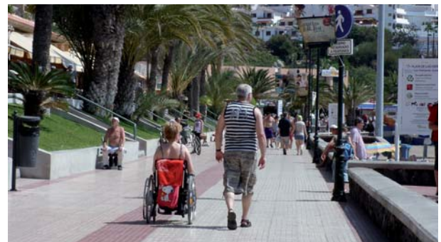
Paseo marítimo de la Playa de las Vistas (Arona, Tenerife Sur).