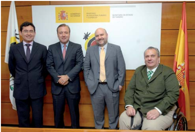
Miembros de PREDIF y CERMI, junto con Joan Mesquida, presidente de Turespaña.

E l Instituto de Turismo de España (Turespaña) y el CERMI acordaron el pasado mes de febrero poner en marcha iniciativas conjuntas para que España sea un destino turístico accesible y abierto para todos. Ambas entidades se comprometen a ejecutar acciones que incrementen la inclusión y la normali-