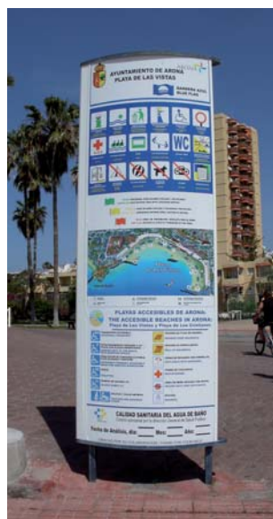
Señalización de los puntos accesibles de la playa y sus servicios (Arona, Tenerife Sur).