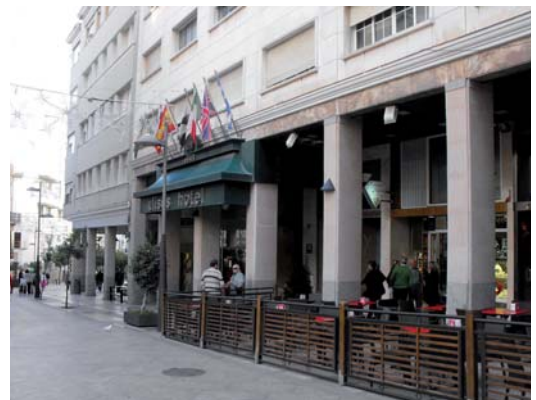
El Hotel Ulises se encuentra junto al casco histórico.