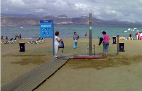
Pasarela de acceso a la playa (Islas Canarias).