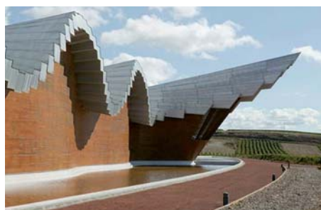
Bodegas Ysios, en Laguardia.

tectónico, inspirado en una copa de vino, fue desarrollado por Santiago Calatrava. El efecto visual, la sublimación de una hilera de barricas, es una composición vanguardista y perfectamente acoplada con el paisaje, hasta el punto de convertirse en un símbolo paisajístico en el entorno. A continuación, nos desplazaremos a Briones, donde daremos un paseo guiado y comentado por este auténtico "pueblo de vino".