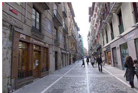
Calle de la Estafeta, en Pamplona.