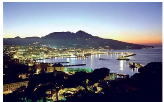
Ceuta de noche.