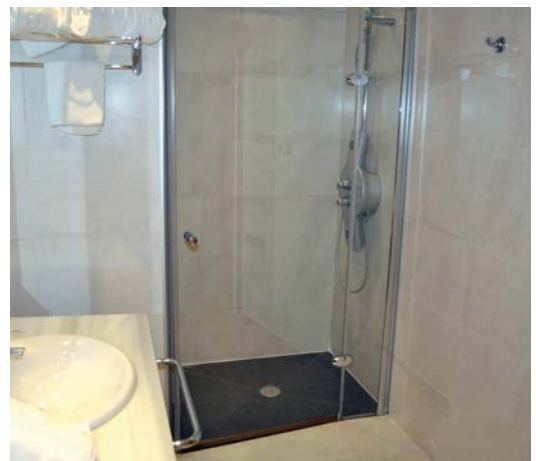
Los baños del hotel están adaptados.