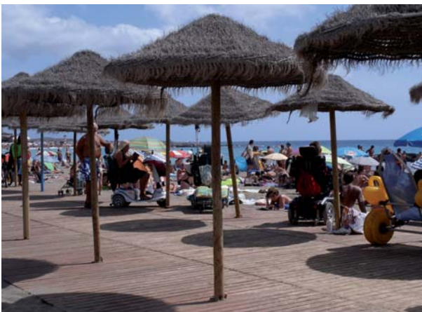
Zona de sombra reservada para PMR (Islas Canarias).