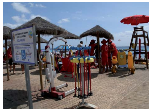
Ayudas técnicas disponibles para PMR.