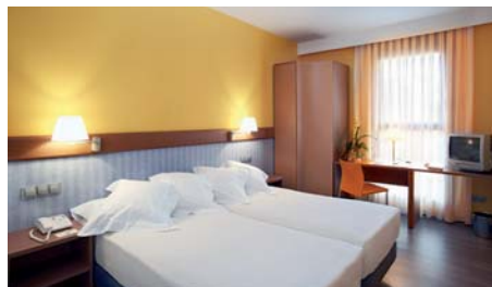
El hotel dispone de habitaciones adaptadas.